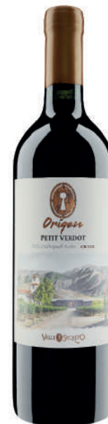
ORIGEN PETIT VERDOT

There are no corners, the movement of the wines is constant without the use of pumps and with this we manage to round tannins that are polished with the porous walls of the tanks (egg form) whose material comes from nature, and even more so from our own Terroir.