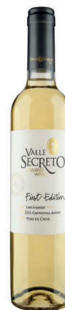
FIRST EDITION VIOGNIER LATE HARVEST