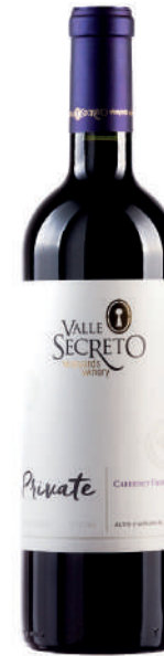
PRIVATE CABERNET FRANC