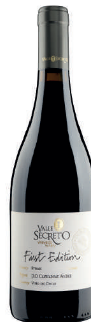
FIRST EDITION SYRAH