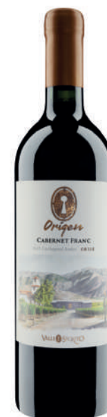
ORIGEN CABERNET FRANC