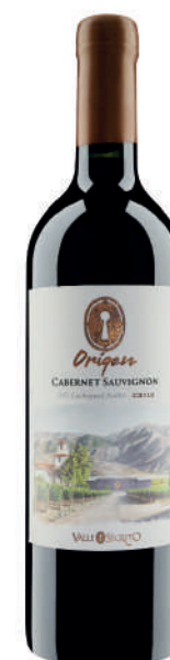
ORIGEN CABERNET SAUVIGNON