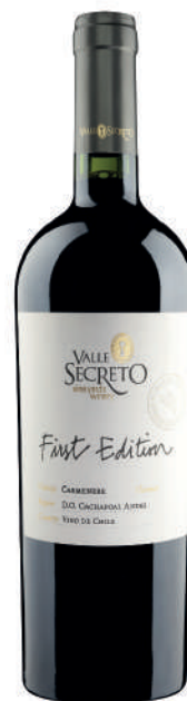
FIRST EDITION CARMÉNÈRE

As its name indicates, this is the first wine bottled by Viña Valle Secreto; its first edition, its first Secret. Its perfect balance of fruit, barrel, acidity and the perfect structure make our exclusive First Edition line a unique wine, destined to surprise and delight.