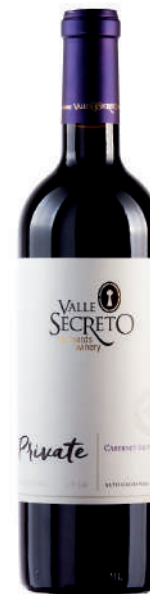
PRIVATE CABERNET SAUVIGNON