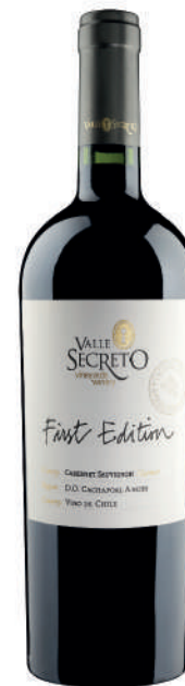
FIRST EDITION CABERNET SAUVIGNON